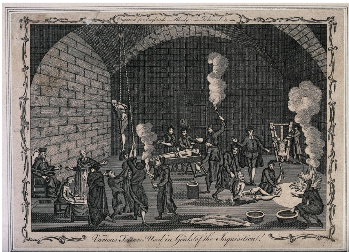
Рис. 2. Усередині тюрми інквізиції

Перш за все, еретика позбавляли одягу, що символізувало усунення всі перешкоди між полоненим і трибуналом. Для жінок цей крок був особливо тяжким психологічно, адже їм приписувалось дотримуватись цнотливості і уникати оголення тіла перед чоловіками. Після роздягання, на людині знищувався волосяний покрив, що дозволяло побачити наявність «відміток» диявола (особливо це стосувалося тих, кого звинуватили у відьмацтві) (Горелов, 2005; Христофорова, 2004).